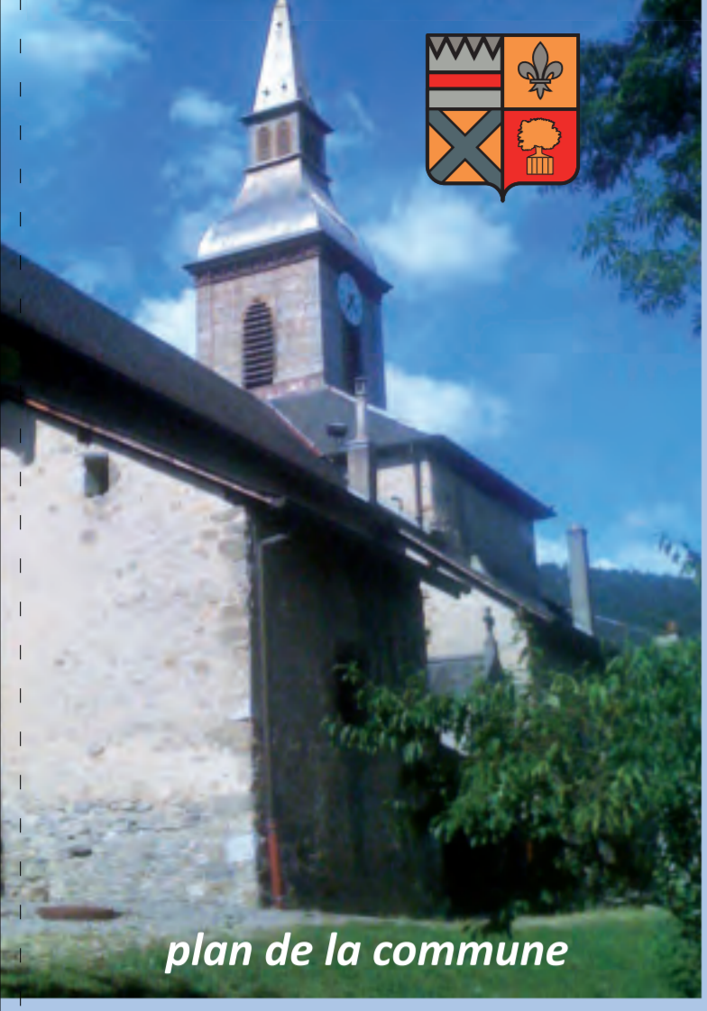
plan de la commune